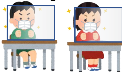
☆(大)は学校机(新・旧JIS規格)にフィットするサイズです